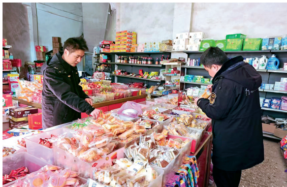
近日，湖南省绥宁县市场监管局在辖区内开展“年关利剑守护”食品药品安全专项整治行动（黄小川供稿）