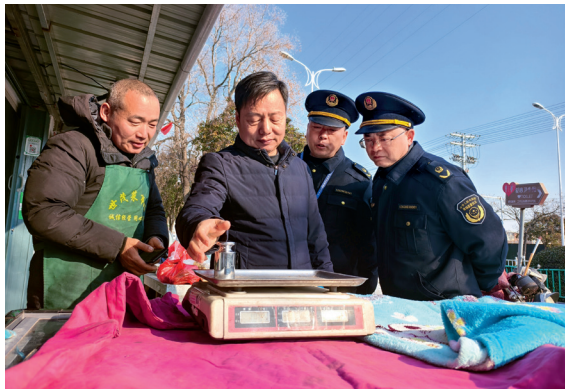
近日，安徽省淮北市市场监管局执法人员深入辖区黄金珠宝店、大型超市、集贸市场等场所，开展电子计价秤专项监督检查（常慕、张珺供稿）